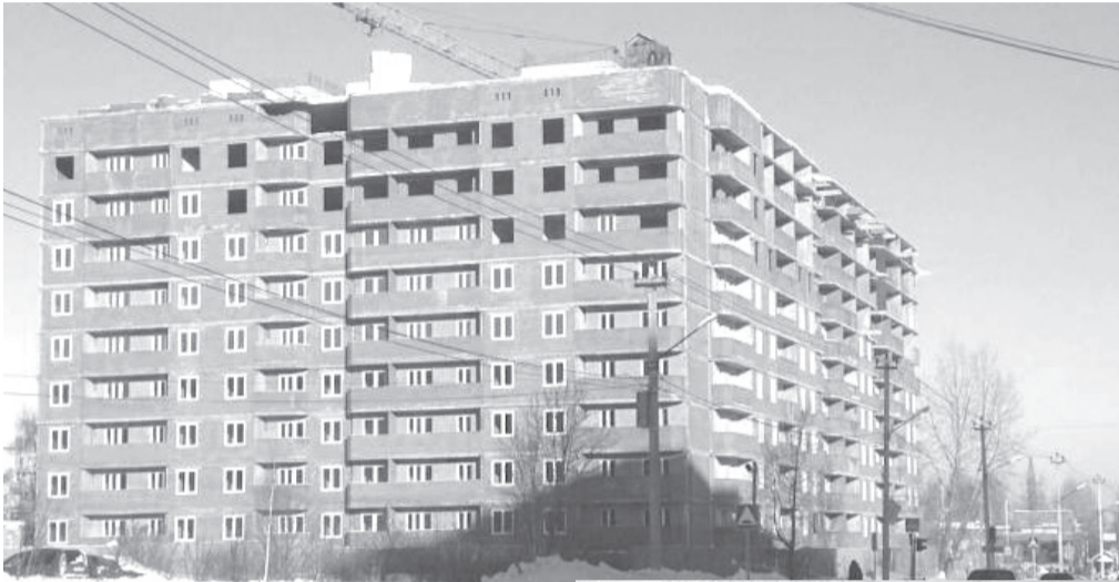
Дом по улице Декабристов, 6. Работы продолжаются.