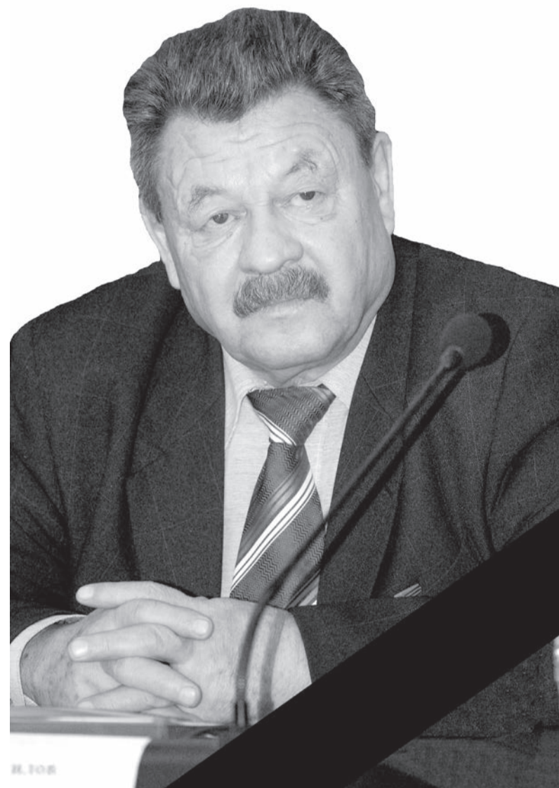
М. Ю. Ю.

Ушёл из жизни человек яркой судьбы, настоящий патриот Чайковской территории, много сделавший для её развития и процветания.